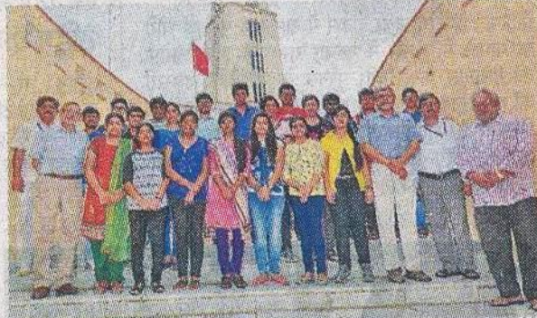
पिलानी. बोर्ड टॉपर्स के साथ वीसी व निदेशक।